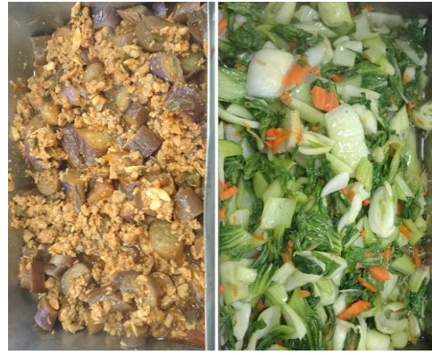
午餐副菜：糖醋茄子 炒青江菜