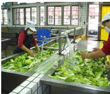
符合三槽水清洗設備