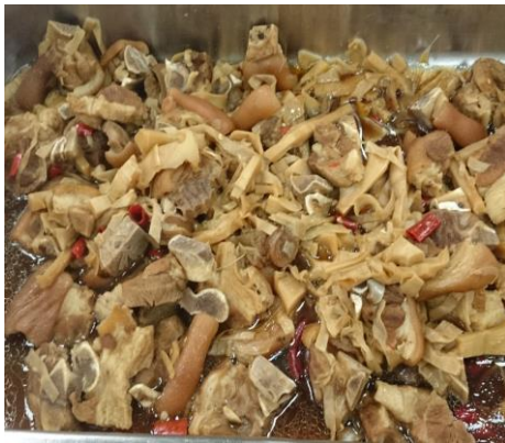
午餐主菜：筍香豬腳