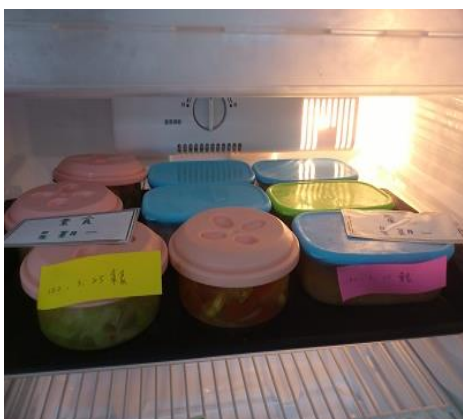
食物留檢專用冰箱