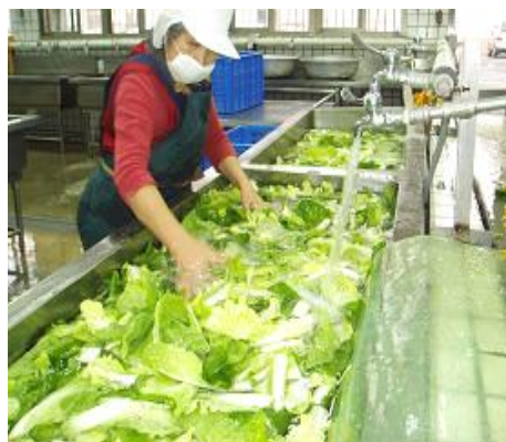
青菜以活水方式清洗減少農藥殘留