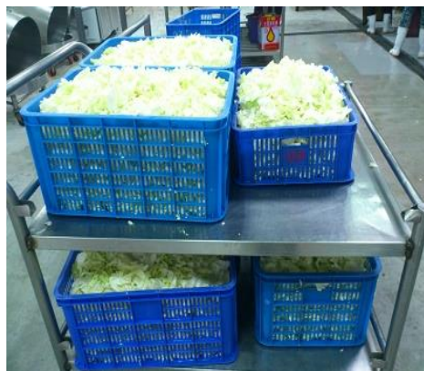
烹調中食材均離地放置