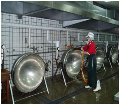
廚房膳後清潔工作