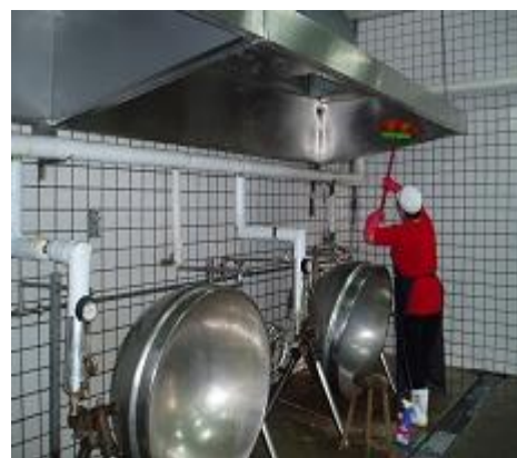
廚房膳後清潔工作