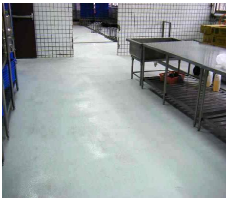
清潔工作完成後的廚房