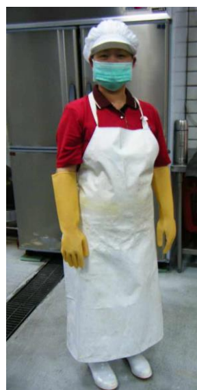
廚師穿戴整齊, 符合衛生