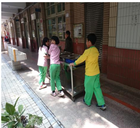
班級推餐車服務同學