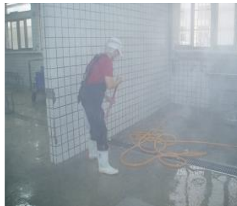
廚房膳後清潔工作